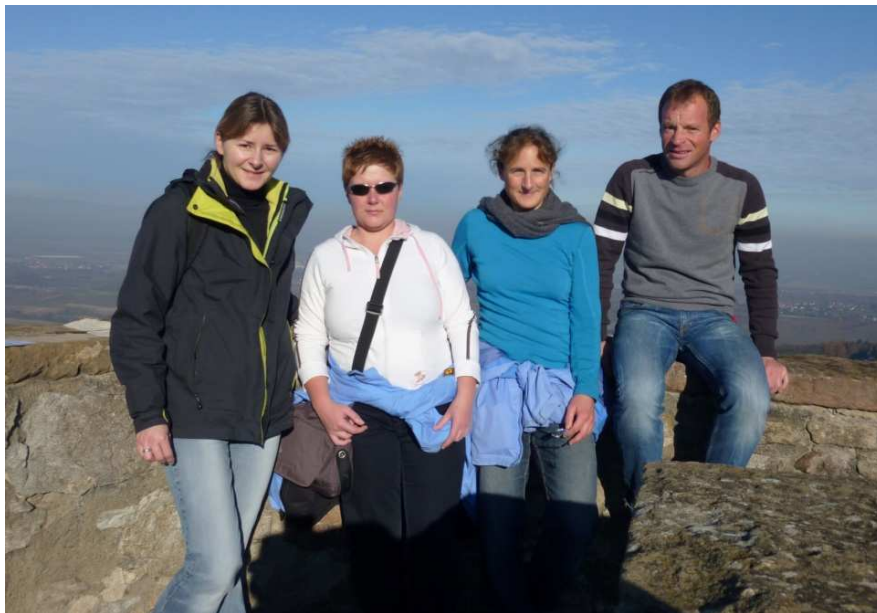
Auf der Ruine Neuenfels

Am Sonntag starteten wir nach dem Frühstück zu einer kleinen Wanderung hinauf zur Burgruine Neuenfels. Bei klarer Sicht konnte man gut den Grand Ballon und den Schweizer Jura sehen. Weiter über den Weinort Britzingen, wo wir noch Trauben in den Weinbergen verkosteten, kamen wir auf dem Markgräfler Wiweg über den Römerberg zurück nach Badenweiler. Bei Kaffee und Kuchen ließen wir das Wochenende ausklingen. Danke allen Teilnehmer fürs aktive Mitmachen, für den guten Austausch und die Gespräche. Es hat mir sehr viel Spaß gemacht. Kersten.