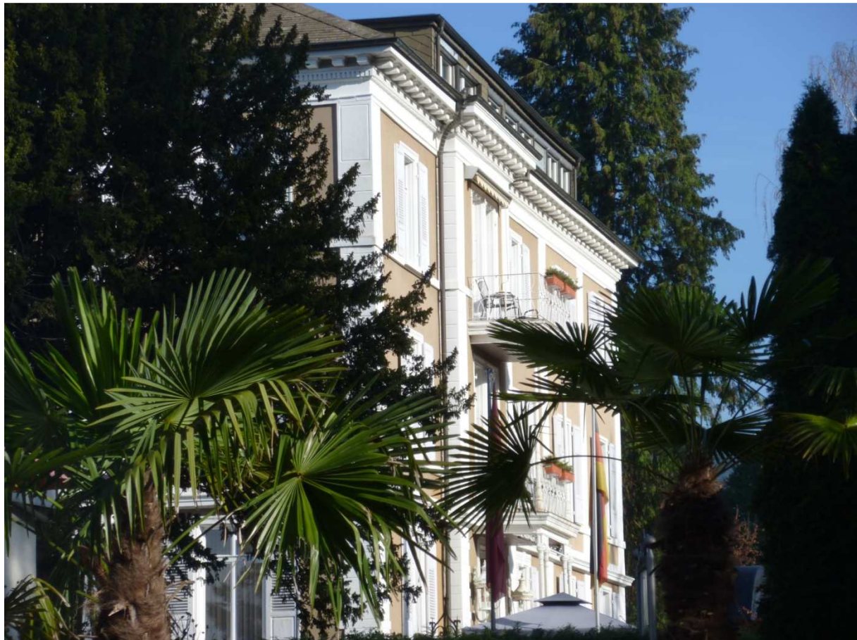
Unser Hotel in Badenweiler

Der Quellaustritt liegt auf 425 m über dem Meeresspiegel. Tägliche werden rund eine Million Liter Thermalwasser ausgeschüttet. Heilanzeigen sind neben Herz- und Kreislaufferkrankungen auch Erkrankungen des Stütz- und Bewegungsapparates (degenerative Erkrankungen der Gelenke und der Wirbelsäule, Arthrose, chronisch entzündliche rheumatische Erkrankungen, etc.)