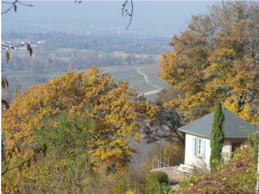
Blick in die Rheinebene

Der kleine Adventsmarkt kam gerade recht, und so konnten wir uns mit Suppe, Waffeln und Glühwein stärken, bevor wir uns Richtung Therme auf den Weg machten.