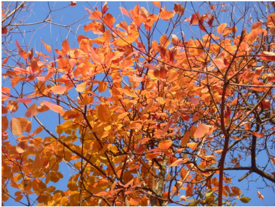
Herbstlaub im Schwarzwald